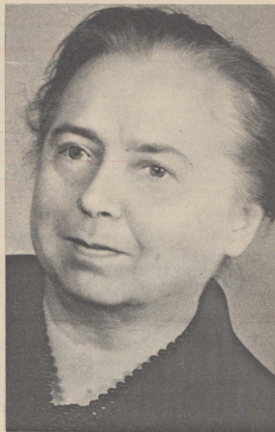
Милица Васильевна Нечкина.

— Какую работу в своей жизни вы считаете самой трудной?