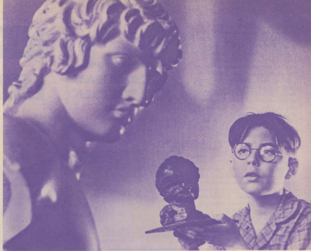
Тайна прекрасного...