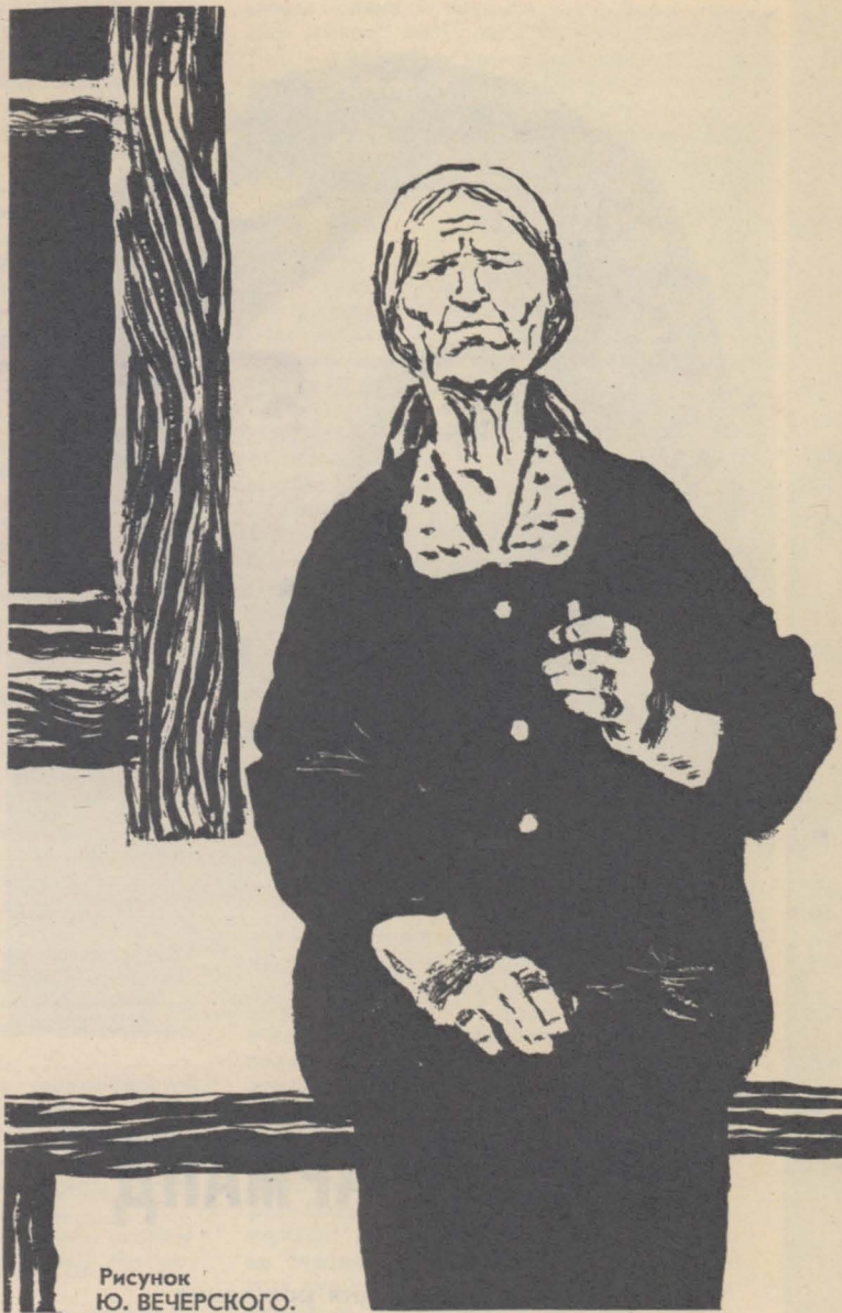
Рисунок Ю. ВЕЧЕРСКОГО.

— Так это, конечно... И про отца знаю и про все... Только мне