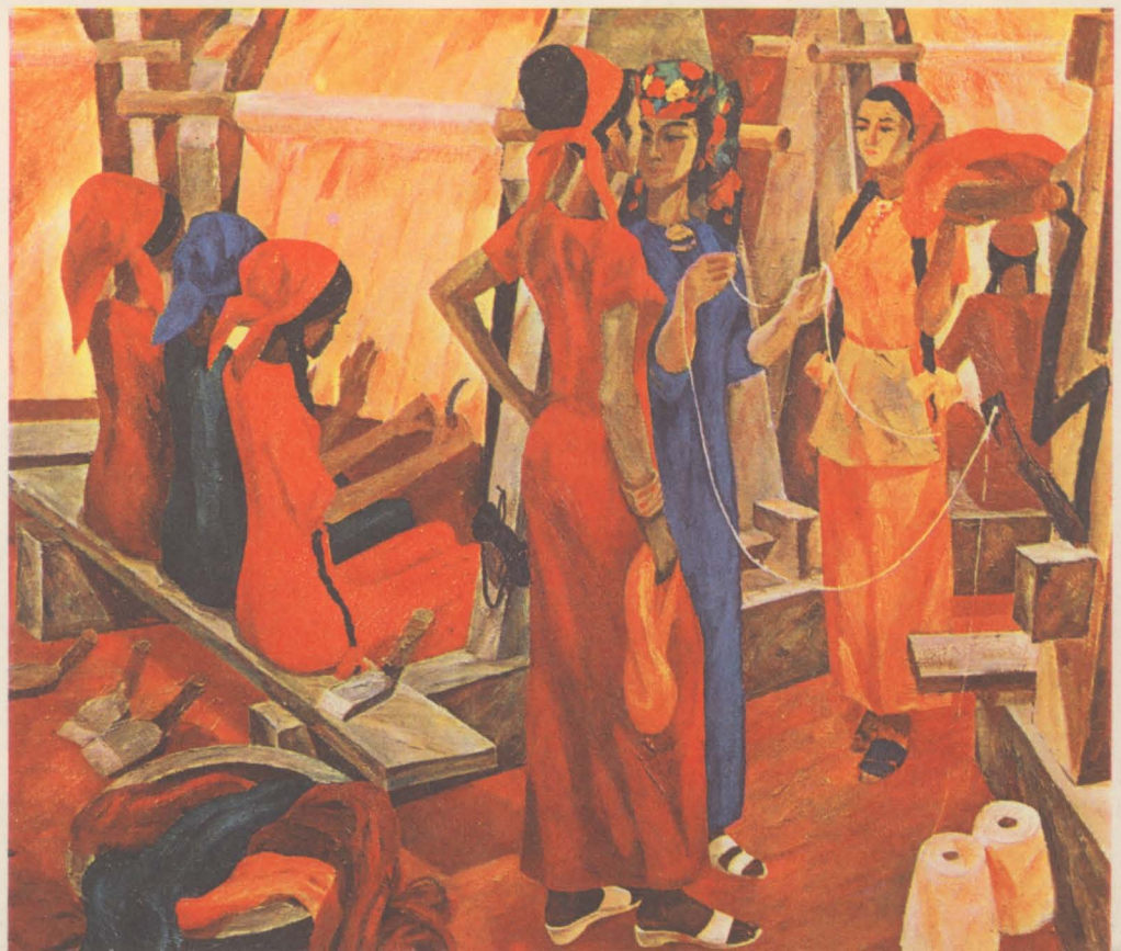
■ Ю. КУГАЧ. ХОЗЯЙКА.